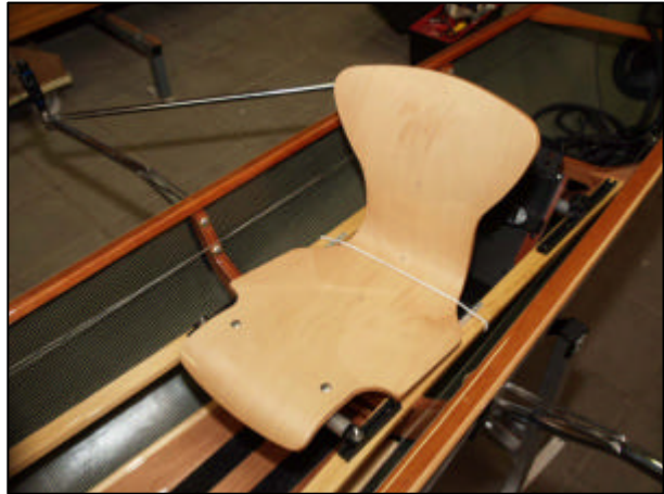
Afb. 1 De stuurstoel met daarachter nog net het voetenbord van de derde roeiplaats zichtbaar.

Bij het gebruik van de Nordhorn als C3- worden er eisen gesteld aan de boeg alswel aan de nummer twee. Dit omdat de boeg de stuurcommando's moet geven en omdat de roeier op plek twee met de voeten (mee) moet sturen. Vandaar dat in ieder geval de boeg een klein stuurdiploma dient te hebben.