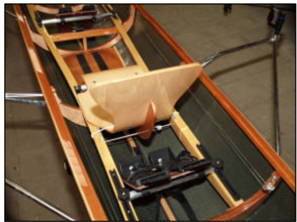
Afb. 4 en 5 Achterzijde stuurstoel met elastiek en voetenbord zichtbaar

Verwijder vervolgens het elastiek wat om de stuurstoel bevestigd zit om de stuurstoel op z'n plaats te houden in de stelling. Verwijder de stuurstoel en verwijder ook de moeren en bouten van de stuurstoel en laat deze aan de stuurstoel vastzitten zodat je deze niet kwijt raakt.