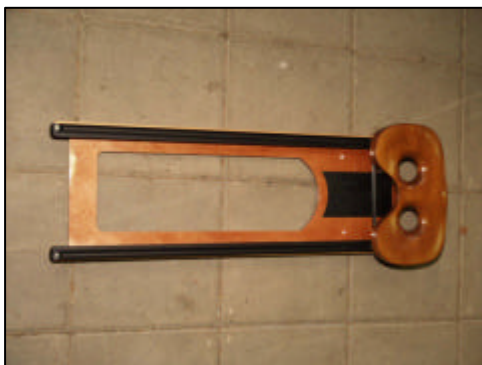
Afb. 6 Derde roeiplek

Nu de stuurstoel verwijderd is, kan de derde roeiplaats geplaatst worden. Deze derde roeiplaats staat normaliter achter het schot waarop alle losse bankjes van boten geplaatst zijn. Voordat de derde roeiplaats in de boot gezet kan worden moeten eerst twee vergrendelingen aan de voor- en achterzijde van de uitsparing voor de derde roeiplek open gezet worden.