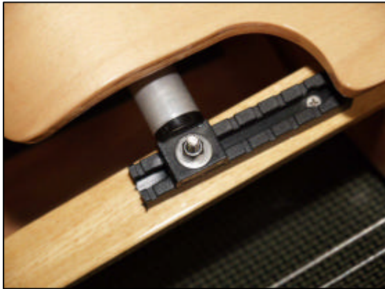
Afb. 2 moerbevestiging stuurstoel