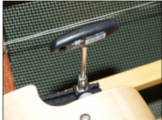
Afb. 3 Moersleutel 10

Verwijder hiervoor de moeren waarmee de stuurstoel aan het 'frame' van de boot bevestigd zit. Gebruik hiervoor bij voorkeur een zogenaamde moersleutel of pijpsleutel nummer 10. Er ligt voor dit doel een moersleutel in de werkplaats in het gereedschapkistje (blauw/rood/geel) in de kast. Deze sleutel is alleen voor de C3 dus na gebruik terugleggen!